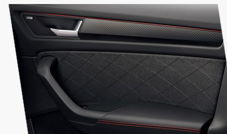
Dveřní výplně s kontrastním černým křížovým prošíváním a červeným prošíváním na loketních opěrkách dveří