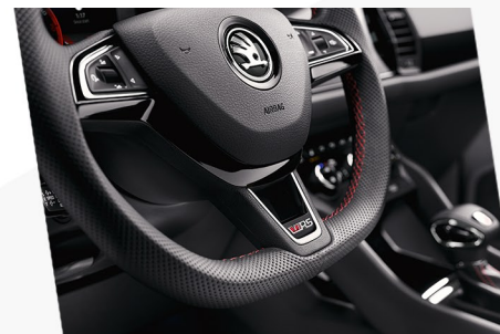
Sportovní multifunkční volant s logem vRS a červeným prošíváním

Interiér: sportovní kokpit a nové designové prvky