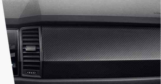
Přístrojová deska s karbonovým vzhledem