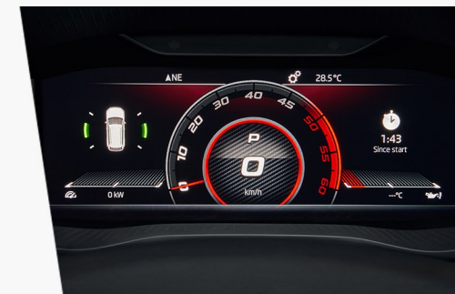
Virtuální Kokpit s novým zobrazením a sportovním karbonovým vzhledem